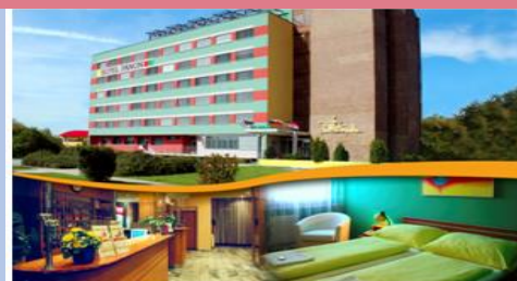
Hotel PANON *** Hodonín

Skorzystaj z okazji, aby spędzić jesienne chwile w hotelu PANON, w przyjemnym regionie winiarskim Moraw Południowych, z wieloma interesującymi miejscami i bogatym życiem towarzyskim - do wypoczynku, relaksu, uprawiania sportów rekreacyjnych lub zwiedzania piwnic winnych, zabytków itp. ciekawych miejsc.